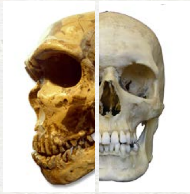
Crâne de Neandertal ( Homo neandertalensis )

A-t-il existé, par le passé, plusieurs humanités ?