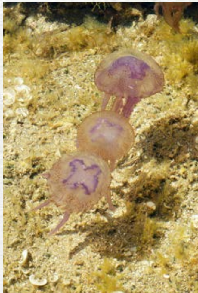
Pelagia noctiluca

Depuis une trentaine d'années les peuplements des océans changent. Peu à peu les méduses sont devenues plus abondantes, perturbant la vie dans les mers. Les mécanismes qui permettent ces pullulations sont d'abord liés au milieu lui-même : changement climatique, acidification et surpêche. Mais les méduses possèdent des possibilités d'adaptation dans leur cycle de vie qui assurent leur prolifération.