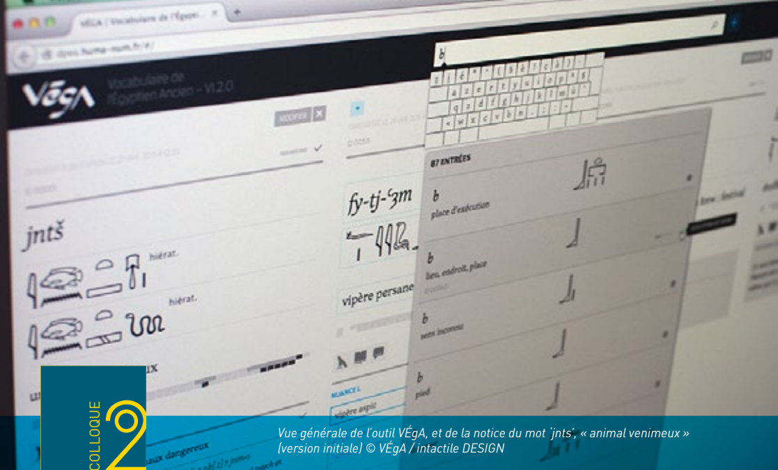
Vue générale de l'outil VEGA, et de la notice du mot 'jntš', « animal venimeux » (version initiale)

Mercredi 28 mars et jeudi 29 mars 2018 8h30 à 17h00 (les 2 jours)