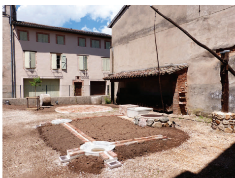
Cour du Muséum, reconstitution du système d'irrigation de l'Hortalisse