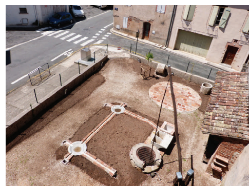
Cour du Muséum, reconstitution du système d'irrigation de l'Hortalisse