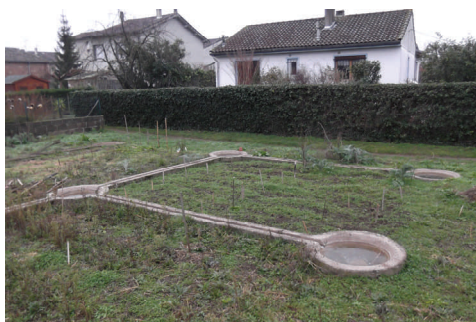
Entre rue d'Alger et rue de Pouille, caniveaux et pousaques sur 1400 m 2