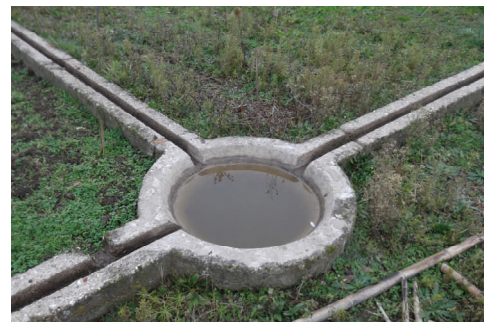
Entre rue d'Alger et rue de Pouille, caniveaux et pousaques sur 1400 m 2