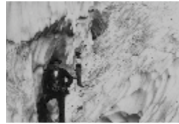
© Cirque de Gavarnie, Rimaye. Photo de Lucien Briet. Coll. Musée Pyrénéen