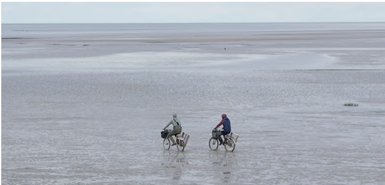
© Viendra la mer, de Marie Chenet et Joël Boulier

Le Festival International du Film d'Environnement revient pour une 13 ème édition du 25 septembre au 1er octobre 2023 à Toulouse et dans toute l'Occitanie.