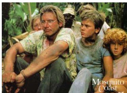
The Mosquito Coast