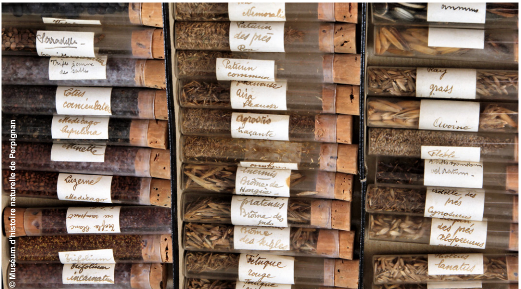
© Muséum d'histoire naturelle de Perpignan

Visite tout public, à partir de 8 ans, renseignements et inscription au 04 68 66 24 78 ou par mail : tda@kimiyo.fr