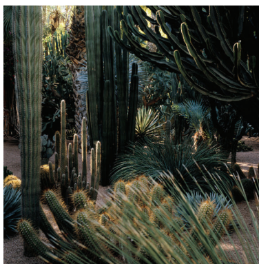
Jardin de cactus, 2016, 120 x 120 cm, tirage Diasec