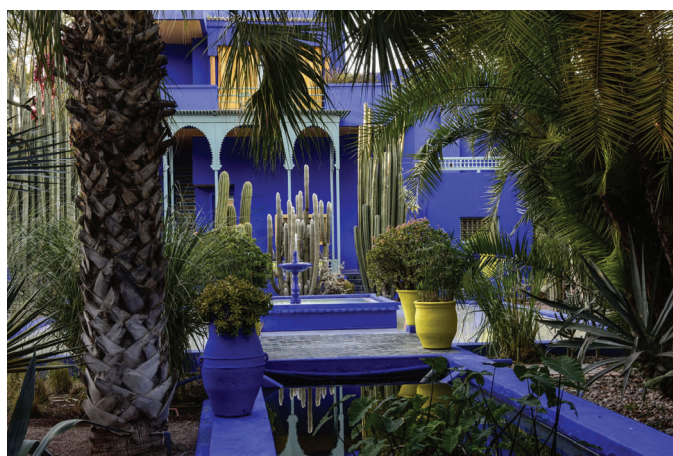
L'atelier de Jacques Majorelle, 2004-2006, 160 x 120 cm, tirage Diasec